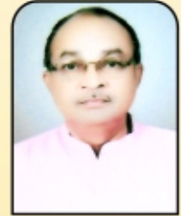
राम चाचेरे संचालक