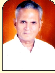
ईश्वरदास असाठी संचालक