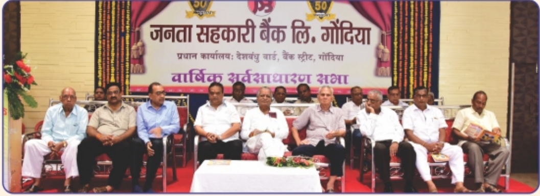
50 वी वार्षिक आमसभा में मंच पर उपस्थित माननीय अध्यक्ष व संचालकगण