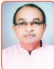
राम चाचेरे संचालक