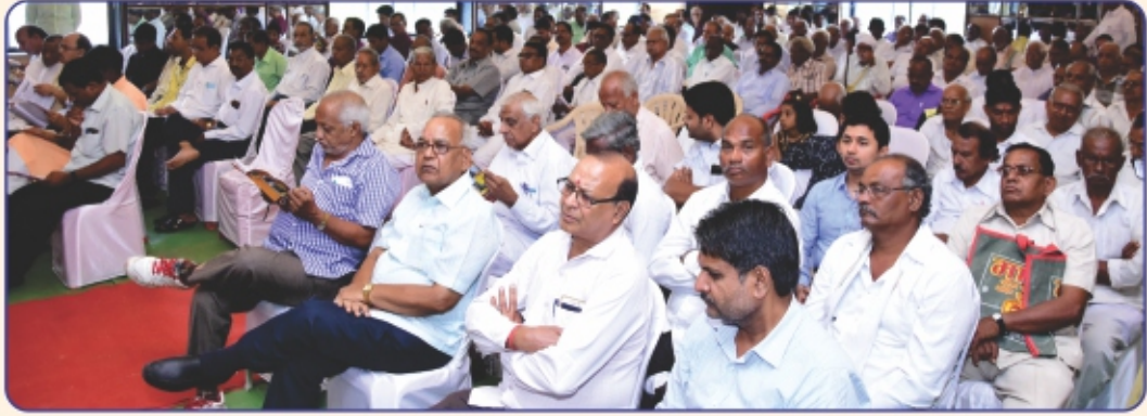
50 वी वार्षिक आमसभा में उपस्थित सदस्य गण